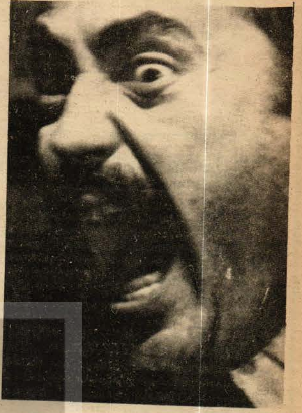
Otobüs filminden bir görüntü.

Sonuç olarak "Otobüs" dünyaya, toplumların gelişmesine tamamen karamsar bir gözle bakıyor. Geri ülkelerin ezilen sınıflarını da, kapitalist toplumların işçi sınıfını da güçsüz, tükenmiş olarak değerlendiriyor. Günümüz dünyasında insanları, toplumları ileriye götüreceği hiç bir umut ışığı, hiç bir itici güç göstermiyor. Kapkaranlık, umutsuz bir dünya tablosu çiziyor. Filmin bu bakış açısı işçi sınıfına ve halka güvenmeyen bir anlayıştan kaynaklanıyor. Oysa günümüz dünyasında ezilen ülke ya da sınıfların ve gelişmiş kapitalist toplumların durumu hiç de "Otobüs"ün düşündüğü gibi değil. Dünyanın birçok geri ülkesinde devrimler oluyor, emperyalistler ve faşistler yıkılıyor ya da geriletiliyor. Birçok kapitalist-emperyalist ülkede ezilen sınıfların mücadelesi ve örgütlenmesi geliyor. Yabancı işçilerin, çalıştıkları ülkelerin işçileriyle birlikte mücadele etmeleri güçleniyor.