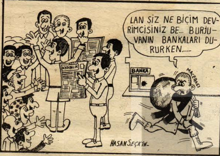
Bir okuyucumuzun gönderdiği karikatür