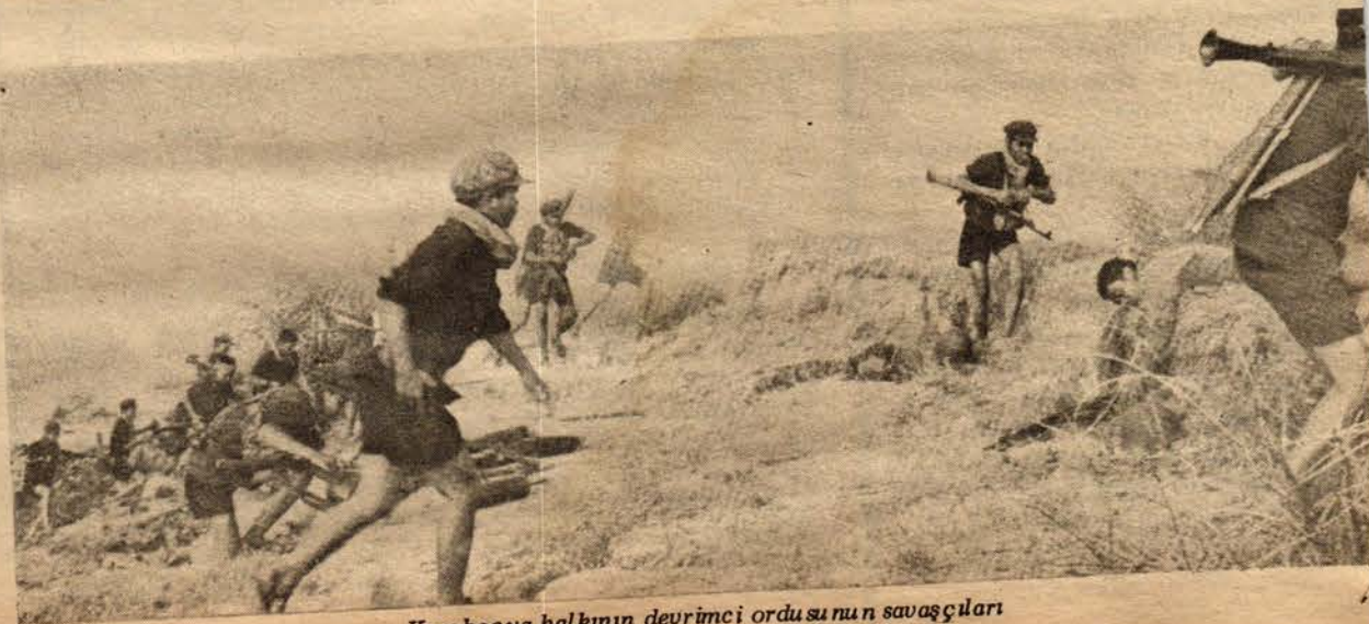
Kamboçya halkının devrimci ordusunun savaşçıları

Sosyalist Cumhuriyeti'nin ordusu, daha sonra 1977'nin Kasım ayında Svay Rieng eyaletini istila etmek için çeşitli saldırılarda bulunmuş, Rumduol, Prasaut, Kompong Rau, Çantrea bölgelerinde onlarca kilometre ilerlemiştir. 1977'nin Aralık ayında ise, pirinç ürününü yağmalamak ve halkı katletmek amacıyla Takeo eyaletinin Koh Andet ve Kirivong bölgelerine ve Kampot eyaletinin Kampong Traç bölgesine karşı da büyük çapta saldırılarda bulunmuştur. "Vietnam Sosyalist Cumhuriyeti"nin saldırgan ordusu, Kamboçya-Vietnam sınırına yakın ya da bitişik bölgeler olan Rattanakiri, Mondulkiri, Kratie, Peri Veng eyaletleri gibi Demokratik Kamboçya topraklarının diğer yerlerini sürekli olarak tedirgin etmiş, top ateşine tutmuş ve taramıştır. "Vietnam Sosyalist Cumhuriyeti"nin ordusu, bu saldırılar sırasında, Trepeang Plong, Sturung, Krek, Memot'ta Kamboçya halkına ait iki-üç bin hektarlık pirinç, Svay Rieng eyaletinde dört bin hektardan fazla pirinç ve Takea eyaletindeki Koh Andet ve Kirivong'dan da iki bin hektardan fazla pirinç yağmalanmıştır. Kamboçya topraklarına yapılan bu saldırılar sırasında "Vietnam Sosyalist Cumhuriyeti" ordusu, her yerde binlerce Vietnamlıyı seferber ederek ve çok sayıda biçer getirerek Kamboçya'nın pirinç tarlalarını ve ambarlarını yağma etmiş ve beraberinde binlerce ton pirinç götürmüştür. Bu saldırgan ordu, küçük plantasyonlarına zarar vererek ve ormanları yakarak Kamboçya ekonomisini baltalamaya çalışmaktadır. Vietnam'ın saldırgan ordu-