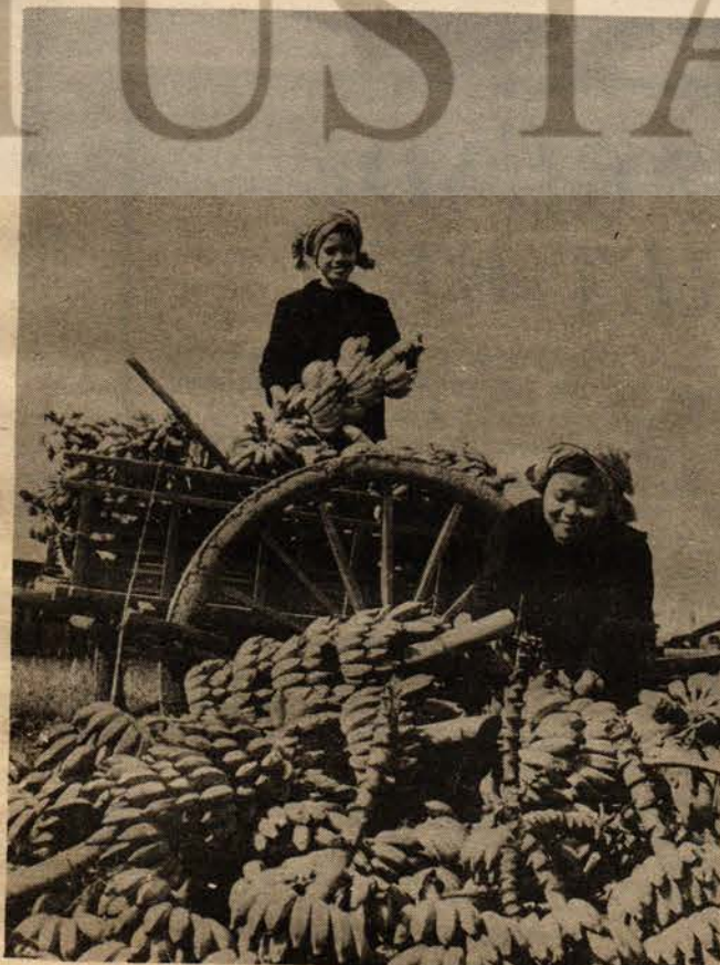
Kamboçya halkı ülkesini barış içinde inşa etmek istiyor

7. Yukarıda saydığımız bütün bu nedenlerle ve Kamboçya halkının ve Devrimci Ordusunun, saldırgan ve işgalci Vietnam Ordusunun zalim ve vahşi işgaline karşı çıkmak zorunda kalması üzerine, Nuon Chea Yoldaşın başkanlığında, 25 Aralık 1977 günü toplanan Demokratik Kamboçya Hükümeti, Kamboçya Halk Temsilciler Meclisi Daimi Komitesi'nin görüş birliğiyle, Demokratik Kamboçya'nın uzak yakın bütün dostlarına ve dünya kamuoyuna, "Vietnam Sosyalist Cumhuriyeti" ordusunun Demokratik Kamboçya topraklarına karşı gerçekten fetihçi ve ilhakçı nitelikteki saldırısını açıklamak için bu bildiriye yayınlama kararı aldı. Kamboçya halkı, bağımsız, egemen ve toprak bütünlüğüne sahip bir Kamboçya'da barış içinde yaşamayı yürekten istemektedir. Kamboçya halkının savunduğu dava, haklı bir davadır, çünkü Kamboçya halkı yeni haksızlıklara karşıdır, bağımsızlığa ve köleliğe