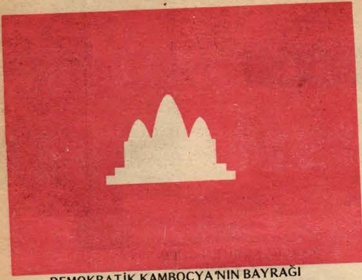
DEMOKRATİK KAMBOÇYA'NIN BAYRAĞI

"Vietnam Sosyalist Cumhuriyeti" ordusunun Demokratik Kamboçya topraklarına karşı ani olarak yaptığı, ilan edilmemiş bir savaş niteliği taşıyan, daha önce hazırlanmış bir planı izleyen, sistemli ve büyük çapta tekrarlanan saldırı ve istila hareketi karşısında Demokratik Kamboçya Hükümeti aşağıdaki açıklamayı yapmıştır.