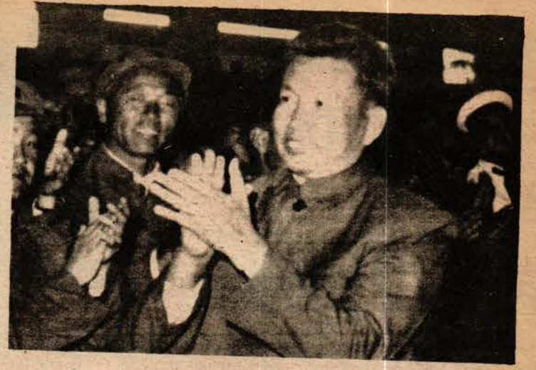
KAMBOÇYA KOMÜNİST PARTİSİ MERKEZ KOMİTESİ GENEL SEKRETERİ POL POT YOLDAŞ

her ne pahasına olursa olsun karşı koyar. Demokratik Kamboçya Hükümeti, emperyalistler, gericiler, yayılmacılar ve onların yandaşları dışında, uzak yakın bütün dostlarının ve dünya kamuoyunun bağımsızlıktan ve adaletten yana olduğuna ve Kamboçya halkının bu haklı davasına destek olmalarına inanmaktadır. Kamboçya halkı, saldırgan Vietnam ordusunun haksız saldırılarını mutlaka alteedecektir.